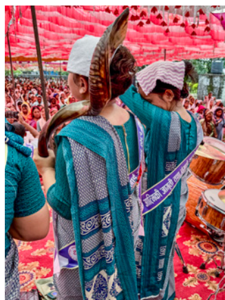
På hvert møde blev der blæst i en shofar.