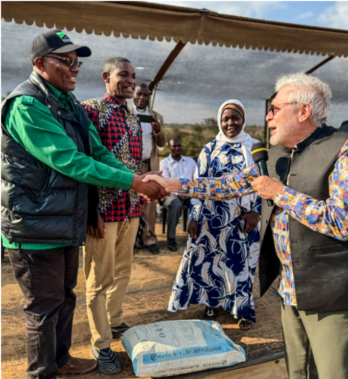
Vi gav en gave til den lokale skole i Itaja: 17 sække cement og to læs med grus, så de kan færdiggøre et byggeri. Landsbyens ledere var taknemlige.

vide, at mennesker går til Helvede, når jeg har den største mulighed til at lede dem til Himlen! Jeg må og ønsker at gøre mit bedste, og Helligånden vil altid gøre det, jeg ikke kan.