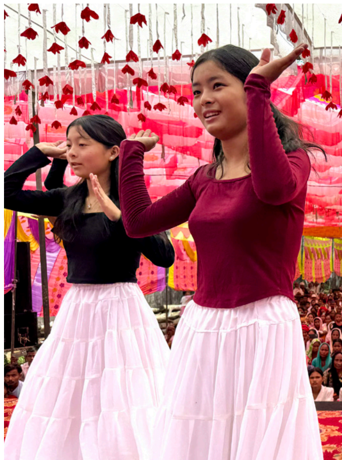
Unge piger udførte smukke danse.

noget. Vi er sikre på, at de registrerede Den Hellige Ånds nærvær.