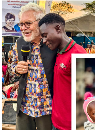
En ung mand er dybt berørt over at opleve frelse og helbredelse.