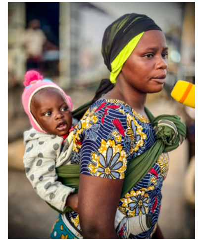
En kræftsvulst i denne unge mors bryst forsvandt øjeblikkeligt under forbønnen.