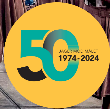
50 år i Tanzania – og vi fortsætter!