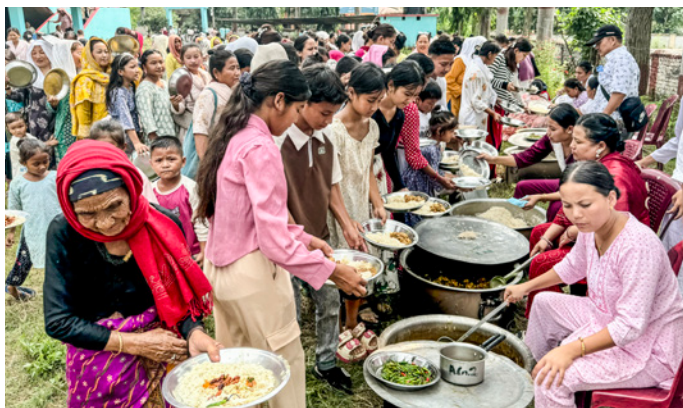
En lang kø af sultne mennesker. Vi gav mad til omkring 5000, mens vi var i Nepal.