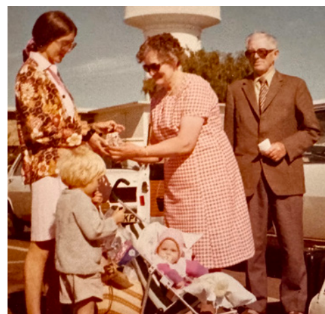
Hannahs forældre besøger os i Tanzania.