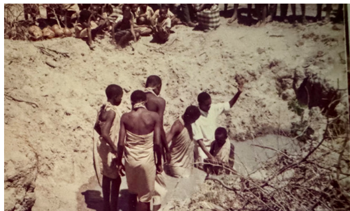
Nye troende døbes i det nærmeste vand: et mudret vandhul