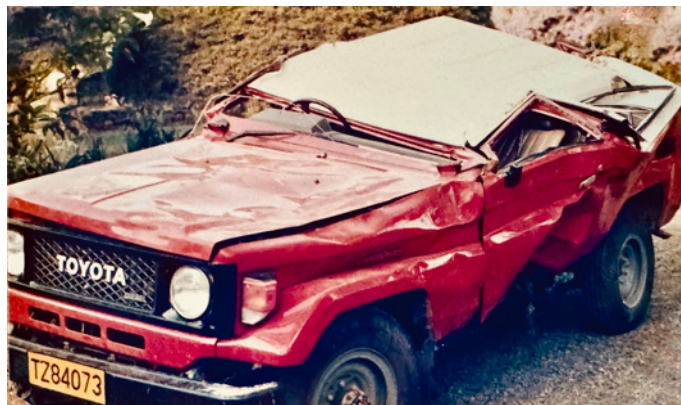
Teamets første bil klarede ikke sin jomfrutur og mødet med en tankbil. Med Guds beskyttelse slap alle passagerer uskadt.