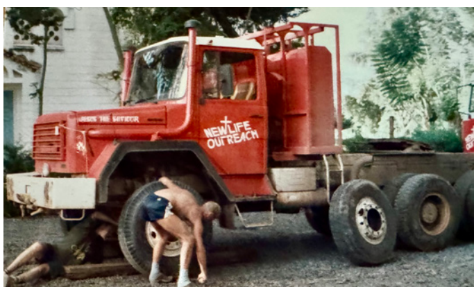
Vores første kampagne-lastbil (kaldet 'Gadaffi') bliver gjort køreklar.

Kun Jesus kan ændre sådan en kultur. Det var vi overbeviste om, og vi begyndte at række ud til disse mennesker, der var så meget anderledes end os. Mændene gik selvsagt altid bevæbnet med et spyd