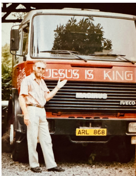
Vores lastbiler, som vi købte af Reinhard Bonnke, har bragt os til alle hjørner af Tanzania.