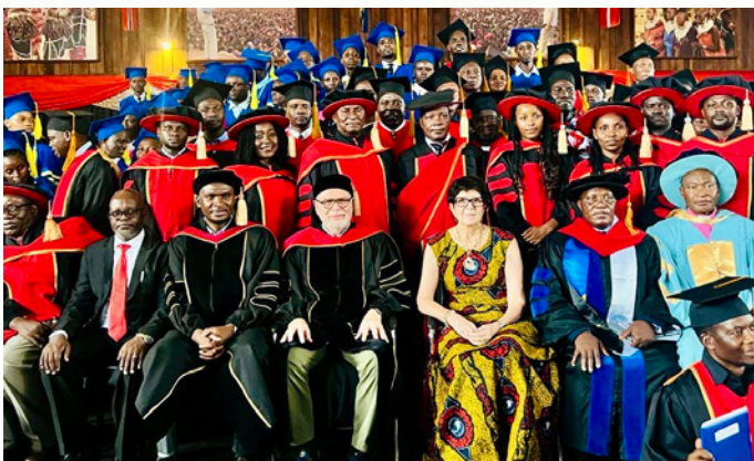
Et udsnit af dette års elever og undervisere på bibelskolen.