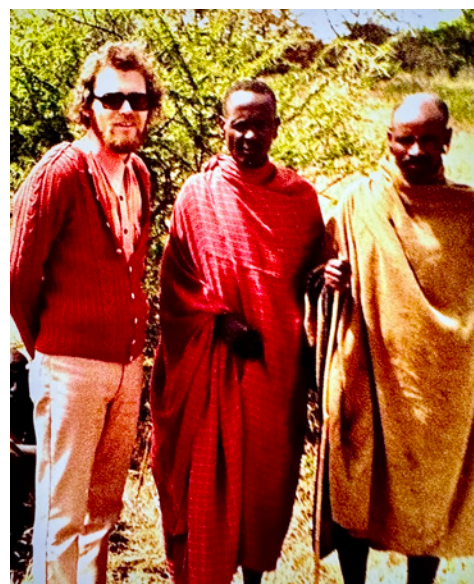
Også den drabelige Barabaig-stamme skulle høre evangeliet.